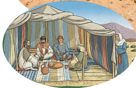
Zo ongeveer kan de tent van Abraham er ook uitgezien hebben.

Een betrouwbaar teken - Elk eurobiljet heeft een watermerk. Dat zie je niet direct, maar als je zo'n biljet tegen het zonlicht houdt is het heel duidelijk! Je weet dan dat het biljet echt is. Zo'n watermerk is niet na te maken of weg te halen. Zo is het ook met het verbond van God met Zijn volk. Zijn volk is Zijn eigendom. In het Oude Testament is de besnijdenis hier een teken van en in het Nieuwe Testament is de doop hier een teken van.